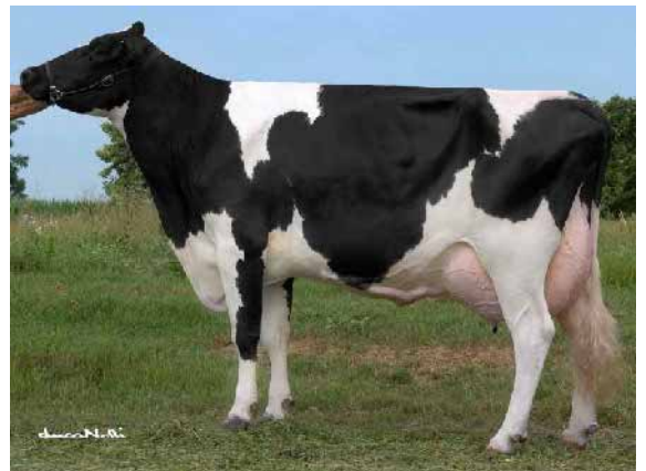
Aquila patron Leane

Leane familjen har idag växt till ca 10 avkomlingar hos oss.